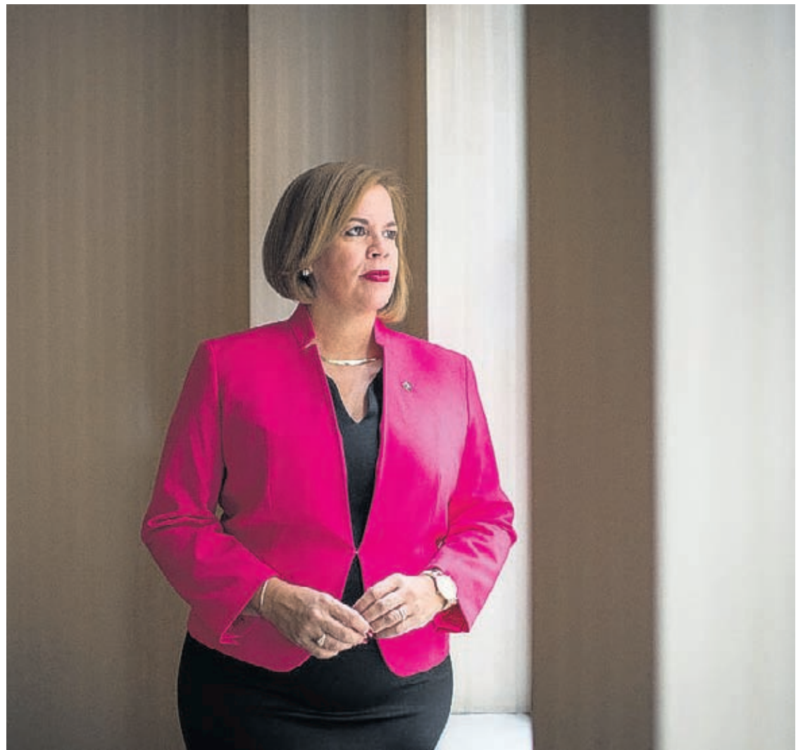
Ban plama e Alegria, Positivismo y Speransa”, Prome Minister Evelyn Wever - Croes a expresa.

Por ultimo, ta hunto nos a logra y ta hunto nos por sigui logra controla e virus pa recupera Aruba su economia y futuro. No ban laga dianan di fiesta bira fiesta pa Covid. No ban plama e virus,